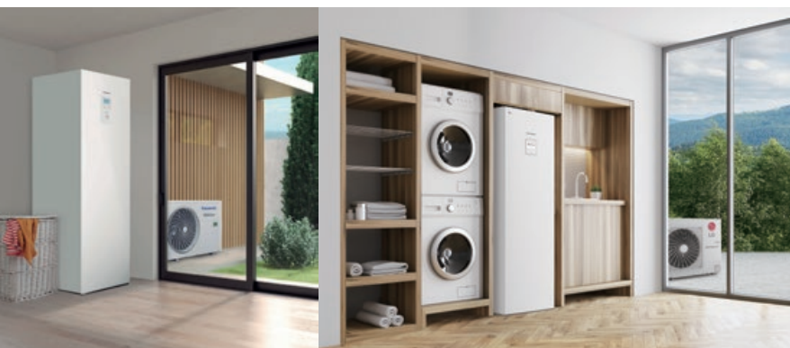
Pompy ciepła firm LG i Panasonic

Nasze pompy ciepła powietrze-woda stanowią kompleksowe podejście do zaopatrzenia domu jednorodzinnego w ciepłą wodę użytkową, ogrzewanie i chłodzenie. Przeznaczone do instalowania w budynkach nowych i modernizowanych, gdzie mogą być zintegrowane z istniejącymi systemami grzewczymi, również z układem kolektorów słonecznych. Szeroki zakres wydajności pomp ciepła pozwala bez problemu znaleźć rozwiązanie dostosowane do indywidualnych potrzeb każdego domu.